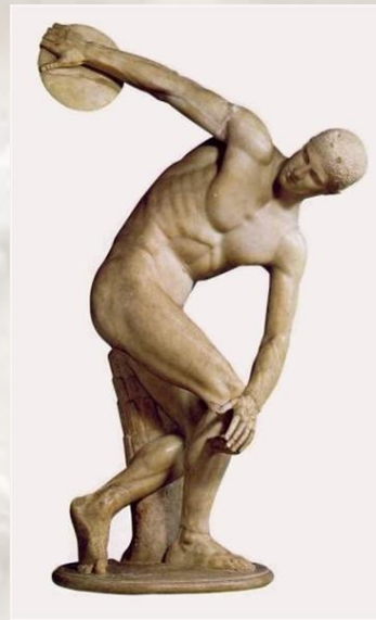
Metalec diska – grška umetnost