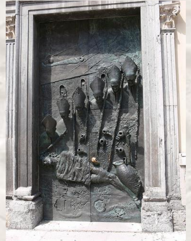
Mirsad Begić, stranska vrata ljubljanske stolnice