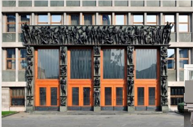
Vhod v stavbo parlamenta

Reliefi lahko nastopajo samostojno, lahko pa so del stavb. Tako krasijo vhode, vrata, okna, stebre, dele sten itd.