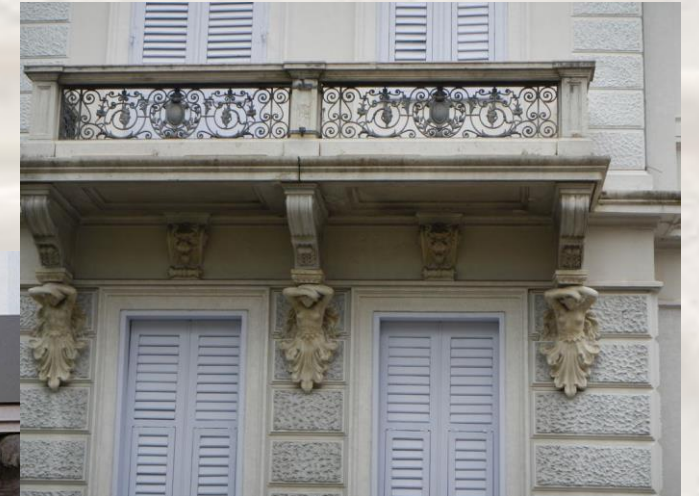
Vila v Gorici