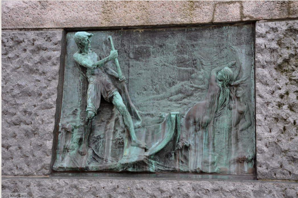
Ivan Zajec, relief na spomeniku Francetu Prešernu