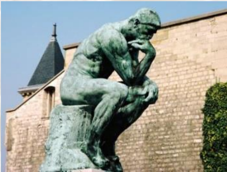
Auguste Rodin – Mislec

Je kip, ki ima svojo obliko, lahko ga obhodimo ter si ga ogledamo z vseh strani (od spredaj, od zadaj ter od strani).