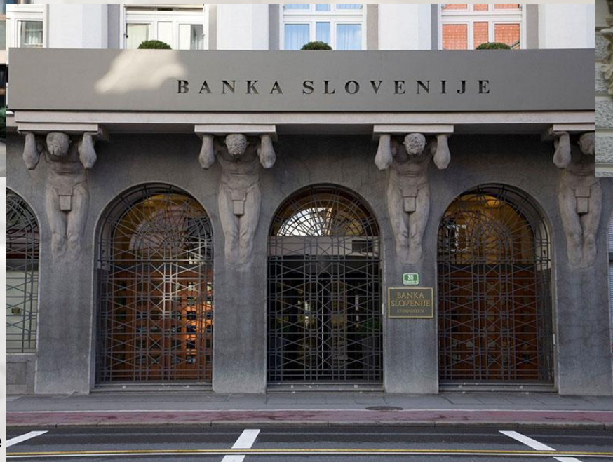
Vhod v stavbo Banke Slovenije