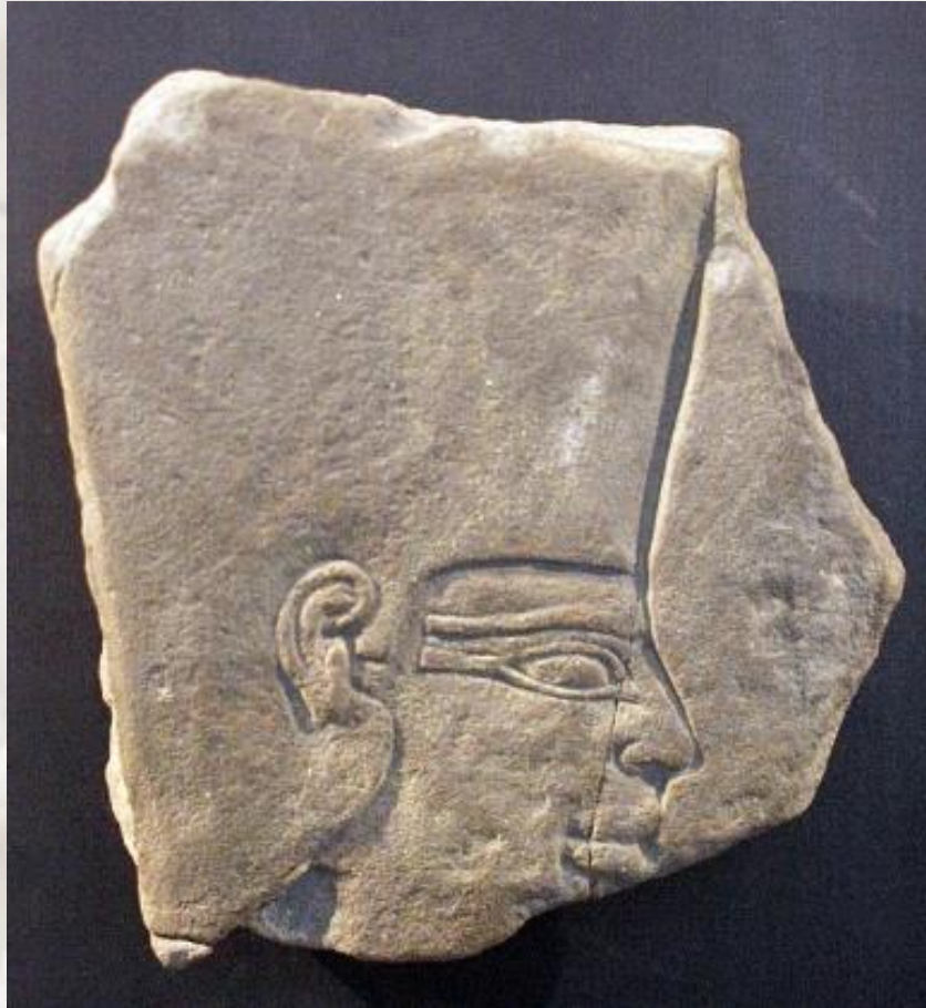
Faraon Mentuhotep, stari Egipt