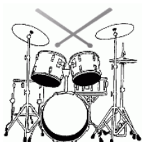
Komplet ali set bobnov